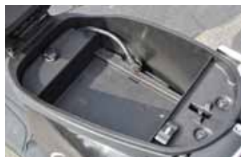
Genoeg ruimte om te gebruiken, Tomos E-Lite.