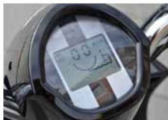
Vrolijk dashboard op de Tomos E-Lite