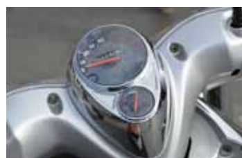
Retro, ook het dashboard.