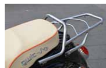
Mooi zadel en dito bagagedrager op de Qwic.