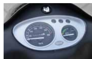
Beetje saai, dashboard Qwic Emoto 87