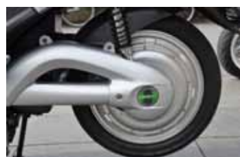
Netjes afgewerkt, de achterbrug van de Nimoto.