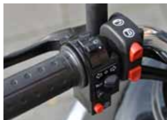
Multifunctionele stuurschakelaar op de Tomos.