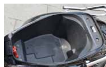
Bruikbaar, de ruimte onder het zadel van de Qwic.