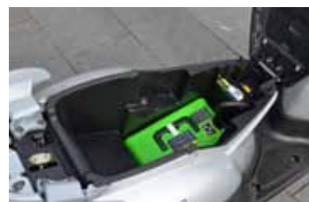
Beperkt maar toch voldoende ruimte.