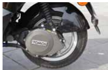
Aandrijving van de Tomos.